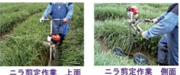
ニラ剪定作業 上面 側面